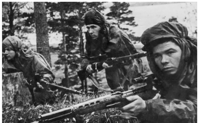
Снайпера 103-го пограничного полка войск НКВД по охране тыла выдвигаются на огневые позиции (Ленинградский фронт)