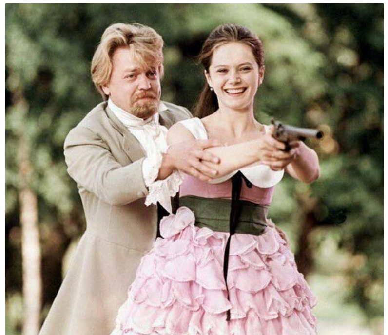
Кадр из х/ф «Дворянское гнездо» А. Кончаловского по мотивам одноименного романа И. С. Тургенева