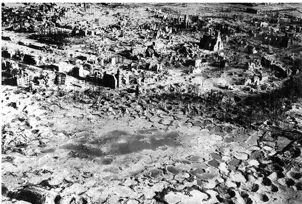
Немецкий город Дрезден до и после бомбардировок, осуществленных Королевскими военно-воздушными силами Великобритании и Военно-воздушными силами США 13-15 февраля 1945 года.

«говорящим ксероксом», пересказывать общеизвестные факты, а подбирать основания, которые убедительно доказывали бы доставшуюся им позицию. С этим справились не все.