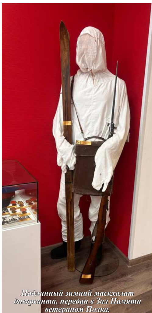
Подлинный зимний маекхалат диверсанта, передан в Зал Памяти ветераном Полка.