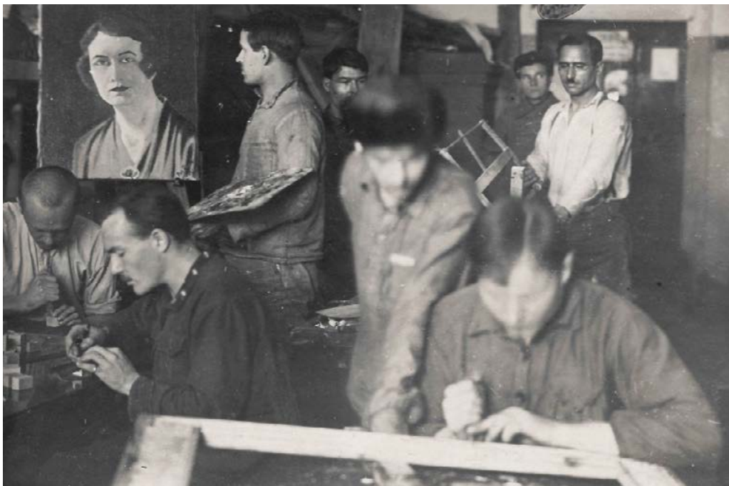
Через художественное творчество — к исправлению. Занятые творческими занятиями осужденные и на заднем плане — всего два охранника. Мастерская Свердловского изолятора. 1925 г.