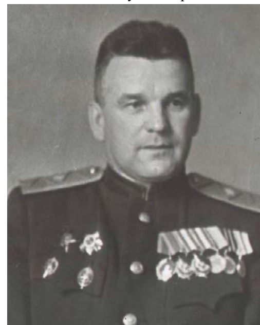
Генерал милиции И.В. Бодунов. 1946 г.